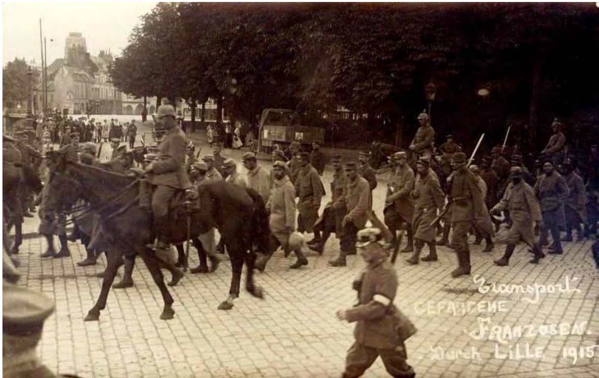
Marsch französischer Kriegsgefangener durch Lille. Der Transport wird geführt durch einen Offizier der Militärpolizei mit Armbinde. Als Bewachung Landsturmmänner mit Militärpolizei und berittenen Feldgendarmen.