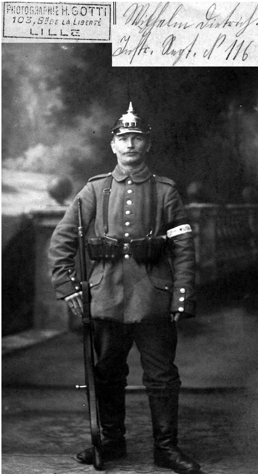
Sächsischer (?) Infanterist mit schwarz/weiß/roter Armbinde und Aufdruck Militärpolizei LILLE. Die rückseitige Beschriftung mit handschriftlichem Hinweis auf einen großherzoglich hessischen 116er ist problematisch, da weder Helmzier noch Schulterklappen damit überein stimmen.