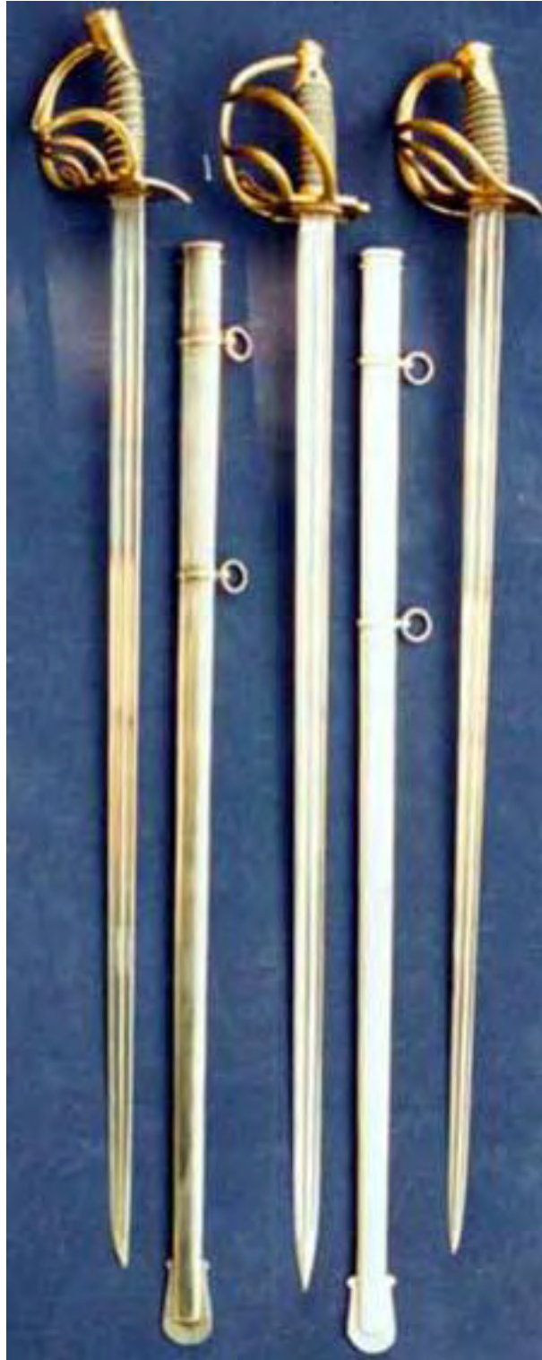
Kürassier-Offizier-Degen fr/F, r/F und M/54. Es handelt sich bei den abgebildeten Degen um Kammerstücke für Portepée-Unteroffiziere. Die privat erworbenen Offizier-Waffen unterschieden sich teilweise erheblich von den offiziell eingeführten Modellen.