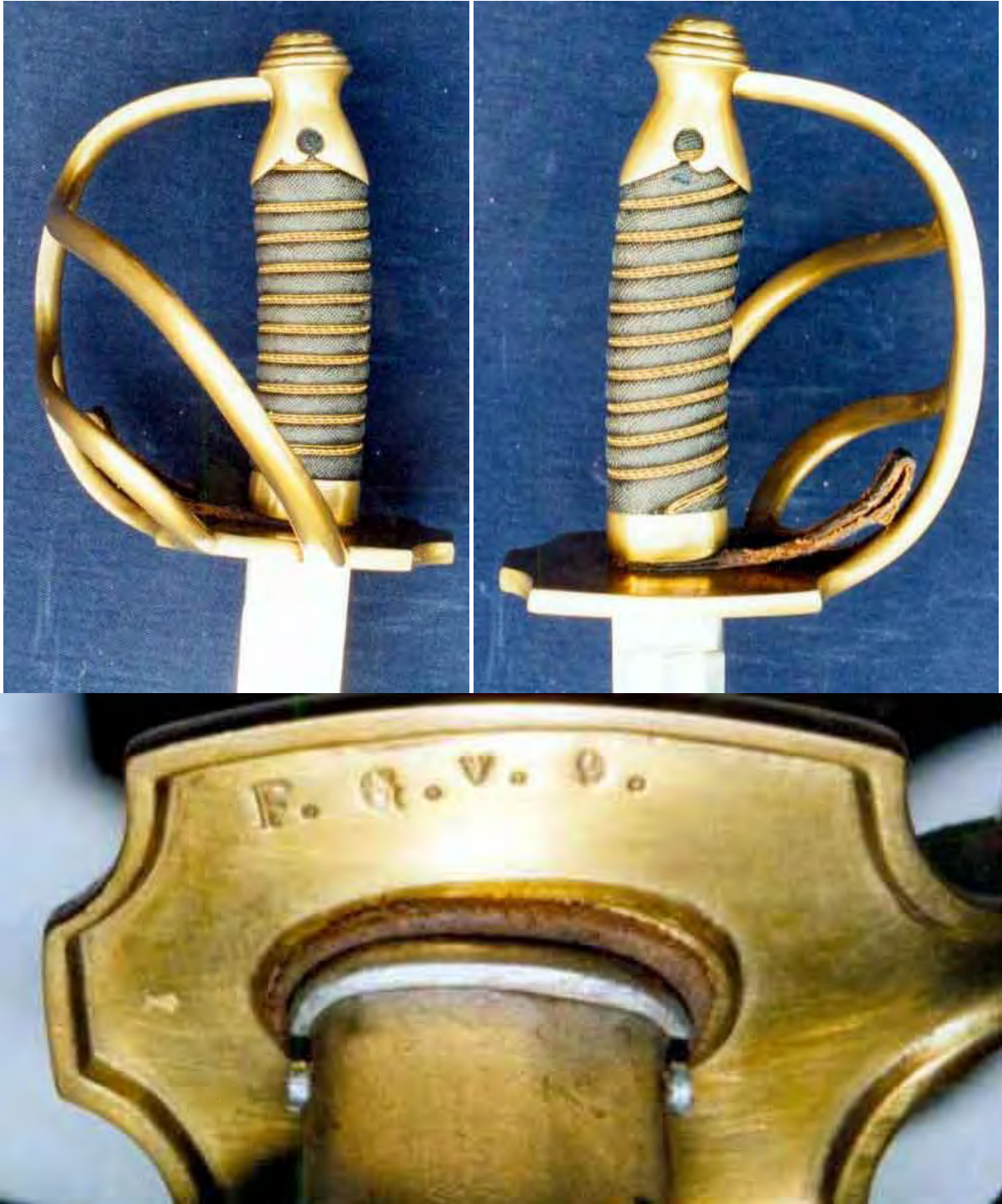
Kammerstück mit Truppenstempel der Feldgendarmarie des V. Armeekorps. Der Abnahmestempel auf dem Klingenhüften noch ohne Jahreszahl sowie keine sichtbare Herstellersignatur. Abweichend vom Mannschaftsmodell besitzt der Offizier-Degen auch bei der russischen Form (r/F) eine Fingerschleife. Preussischer Truppenstempel: Feldgendarmarie des V. Armeekorps, Waffe Nr. 9.