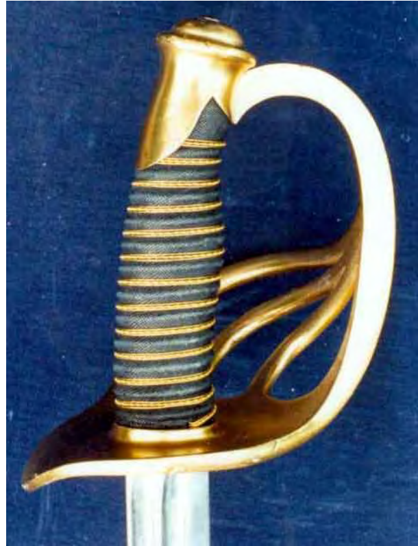
Kürassier-Offizier-Degen M/54 (26). Der 1912 von Carl Eickhorn gefertigte Degen trägt den Truppenstempel der 8. Jäger zu Pferde. Auch hier wieder die von den früheren Modellen her bekannte Oberwicklung, abweichend nun aber das fehlen der Fingerschlaufe.