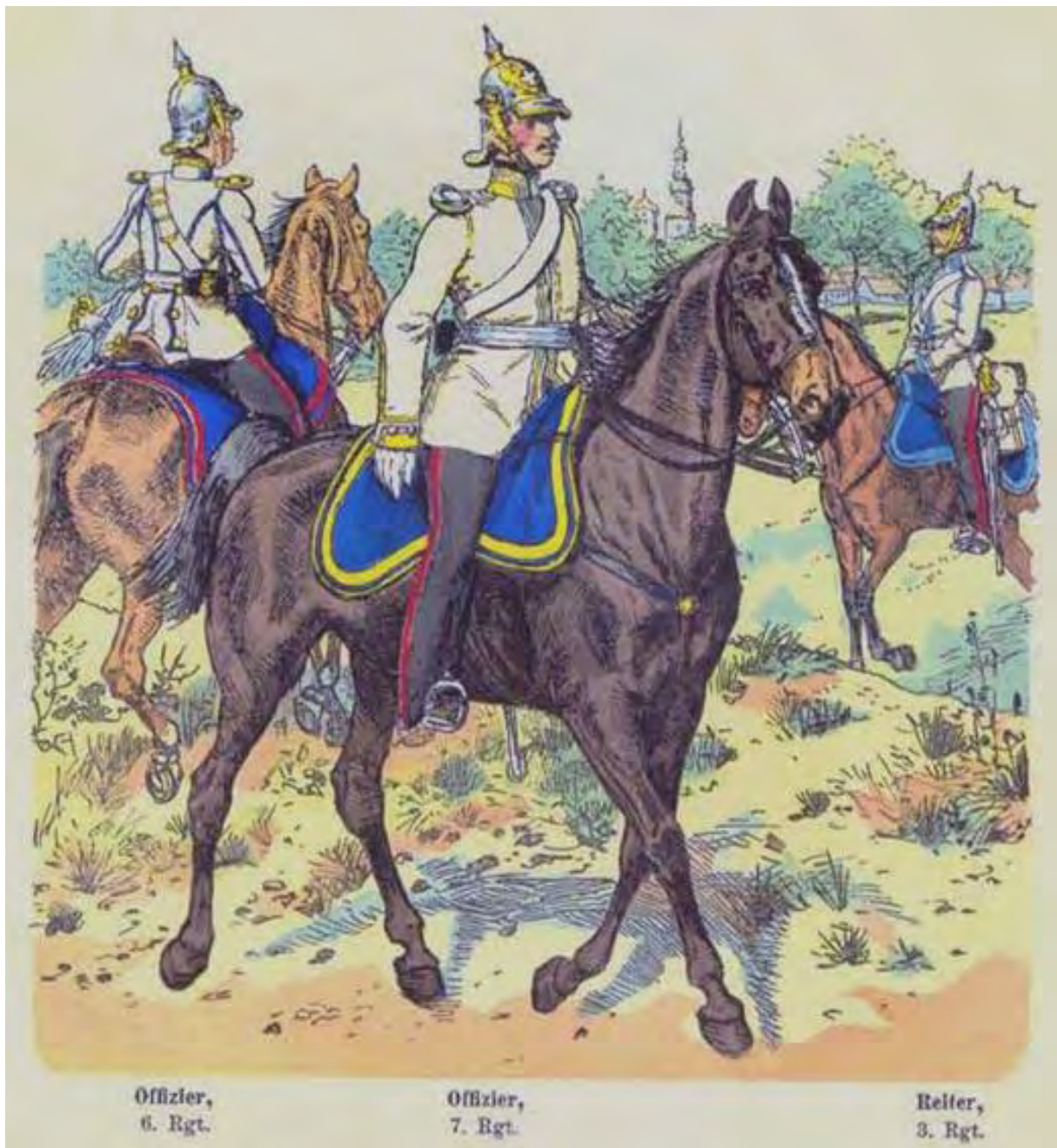
Schwere Landwehr-Reiter-Regimenter 1857-1860 von Richard Knötel. Band XII, Tafel 11.