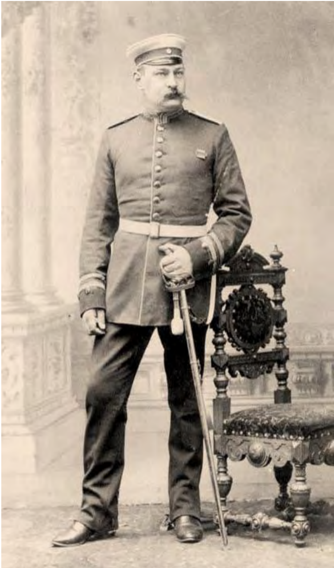
Etatmäßiger Wachtmeister vom Kürassier-Regiment Nr. 8 in Deutz im blauen Waffenrock mit langer Hose und Mütze (Ausgehanzug). Aufnahme vor 1897, da noch keine Reichskokarde an der Mütze. Der Degen dürfte ein privat erworbener K.O.D. M/54 (28) sein!