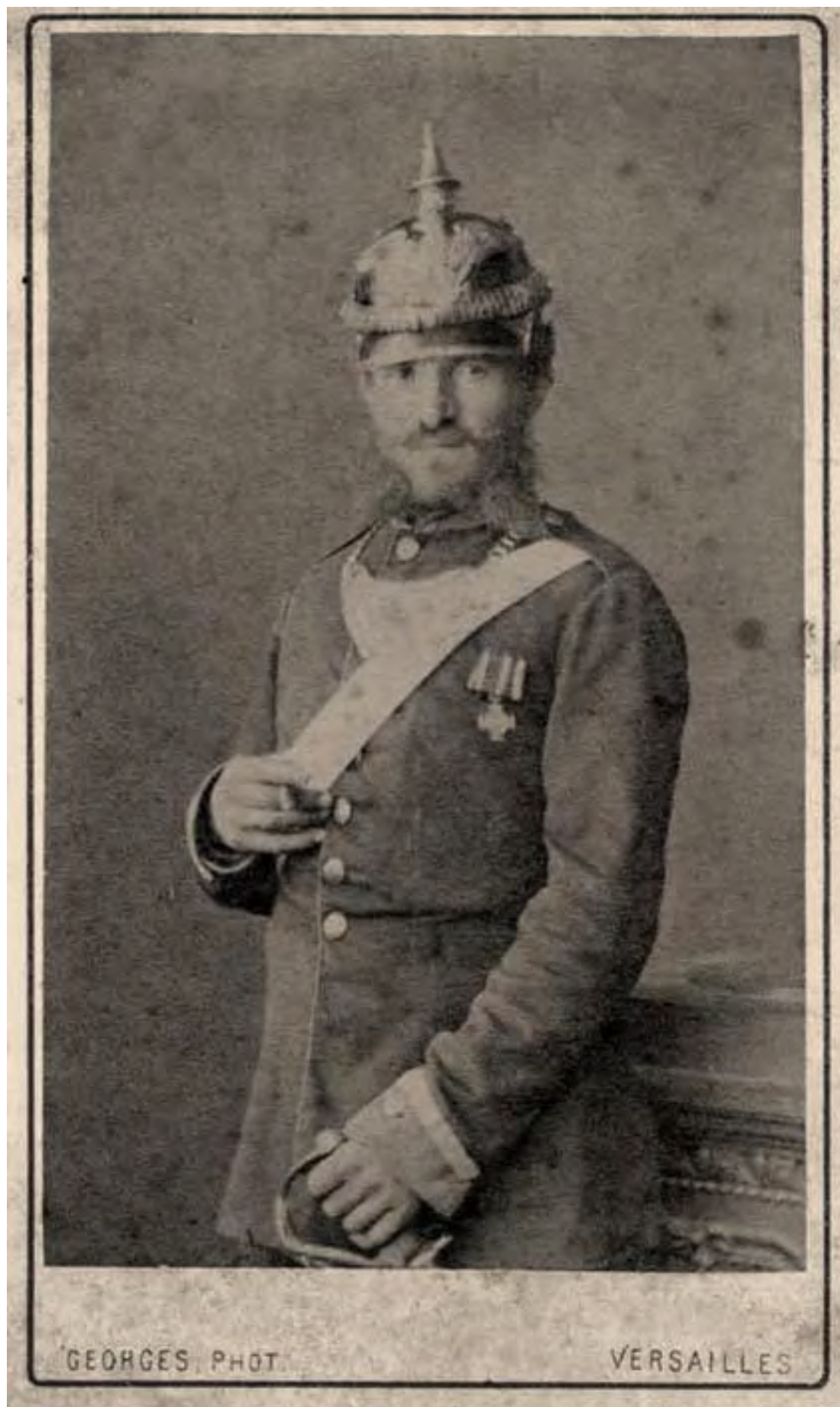
Preussischer Feldgendarm mit Kürassier-Offizier-Degen r/F 1871 in Versailles.