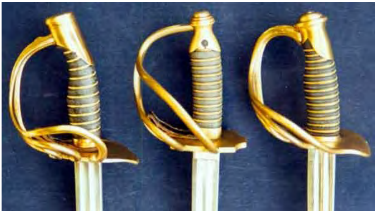
Kürassier-Offizier-Degen französischer Form (fr/F), russischer Form (r/F) und M/54 (v.l.n.r.).