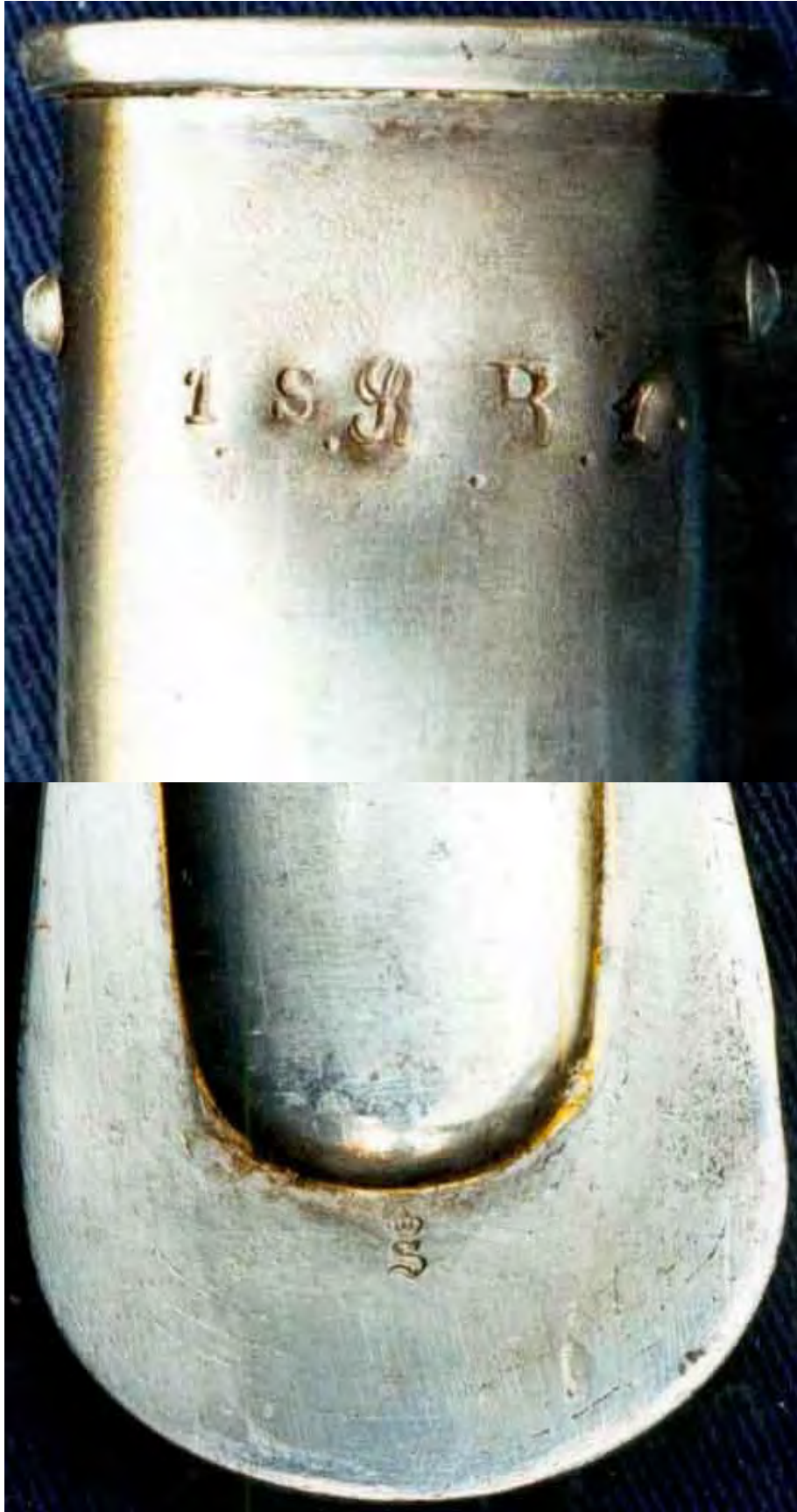
Schlepper mit Abnahmestempel in Form eines S unter Krone. Kürassier-Offizier-Degen r/F um 1870.