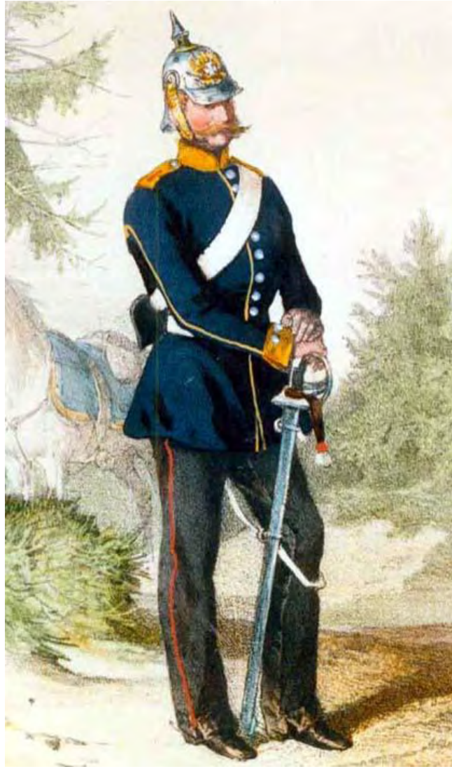
Wehrreiter vom 1. schweren Landwehr-Reiter-Regiment nach 1852 von Ludwig Burger (29, 30).