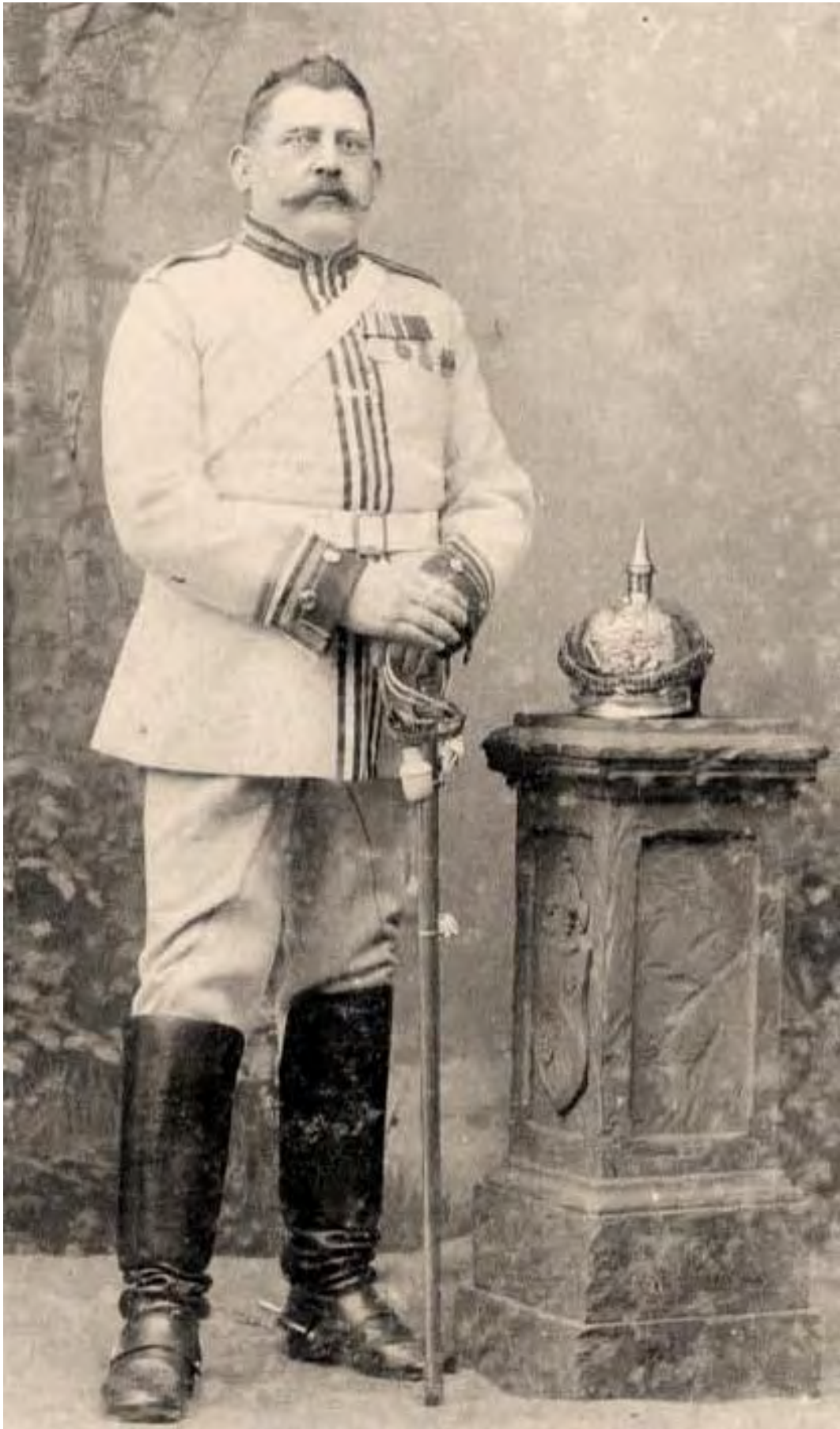
Etatmäßiger Wachmeister vom Kürassier-Regiment Nr. 8 im Dienstanzug vor 1895. Geführt wird noch der K.O.D. r/F. (Sig. Reibetanz) Die beiden Truppenstempel an der Stichblattunterseite.