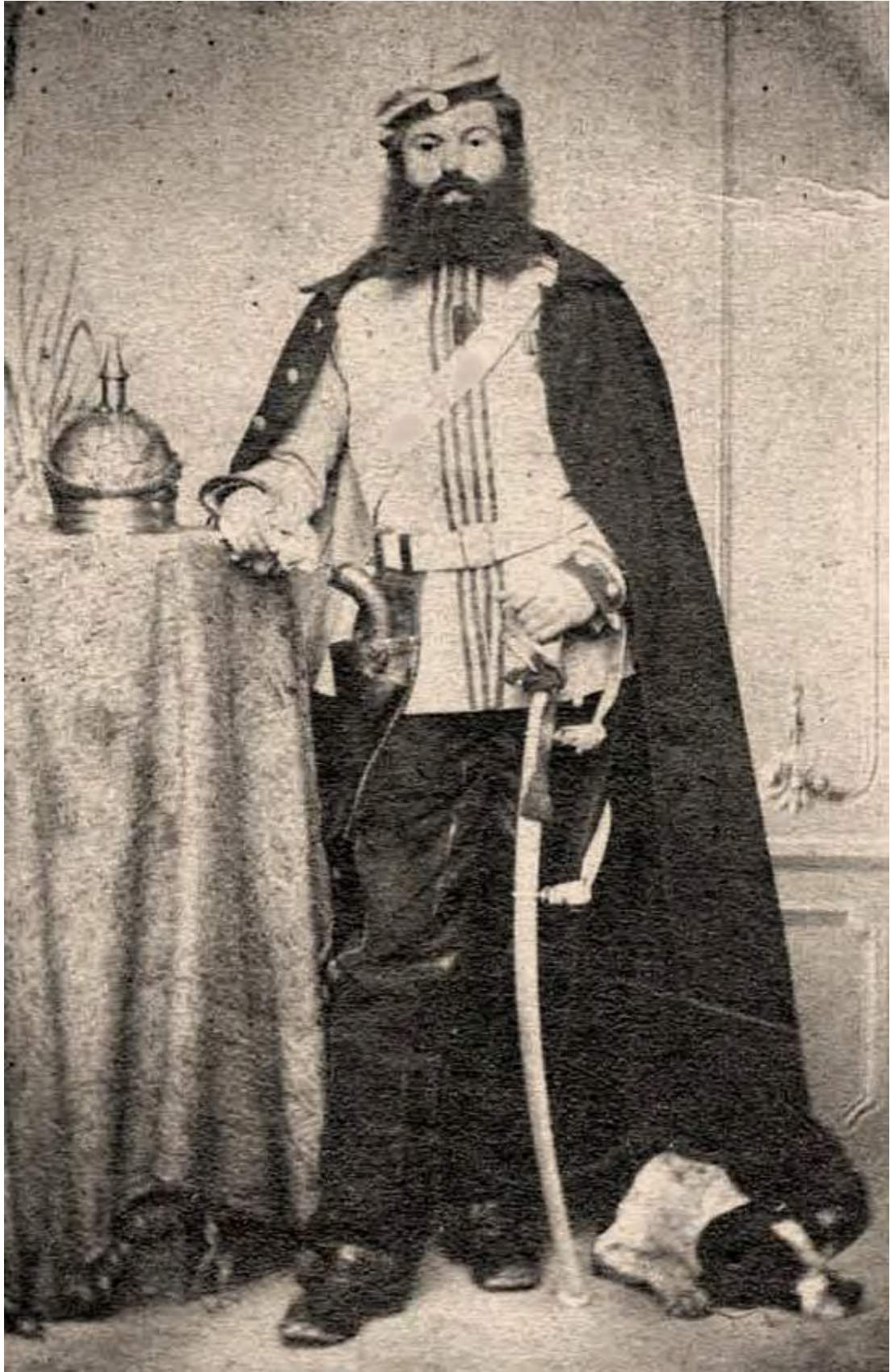
Ein „schwerer Landwehrreiter“ 1871 in Frankreich mit Kavallerie-Säbel M/1849 und Kavallerie-Pistole M/1850. Nach dem Foto ist davon auszugehen, daß Bestände dieser Kavallerie-Säbel später auch noch zur Bewaffnung von Teilen der Landwehrkavallerie bereit gehalten wurden. Das Modell läßt sich – noch mit Seitenbügeln – auch Mitte der 1850er Jahre bei der Artillerie nachweisen. Vorhandenen Stücke wurden auch zum Kavalleriesäbel n/M (33) bzw. zum sogenannten "langen Artilleriesäbel" durch Entfernen der Seitenbügel aptiert und später nochmals verkürzt zum Artilleriesäbel n/A.