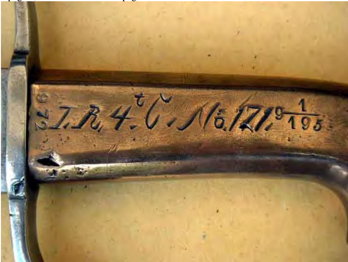
Musketier-Degen neuer Facon, Infanterie-Pallasch, Suhler-Seitengewehr bzw. auch Infanterie-Seitengewehr 1808. 1. (Linien-) Infanterie-Regiment, 4te Compagnie, Waffe Nr. 171