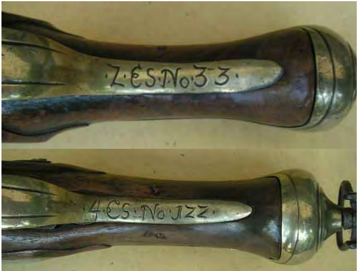
Kavallerie Pistole 1816/40:

Kürassier-Pistole 1763: 2. Eskadron, Waffe Nr. 33 / 4. Eskadron, Waffe Nr. 122.