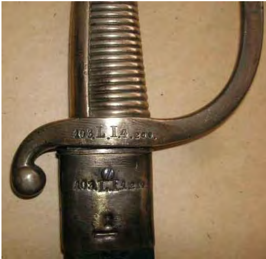
Infanteriesäbel französischer Facon: 4. Landwehr-Regiment Nr. 103, I. Bataillon, 4. Kompagnie, Waffe 202. Die Kompagnien waren innerhalb der Btl. durchnummeriert!