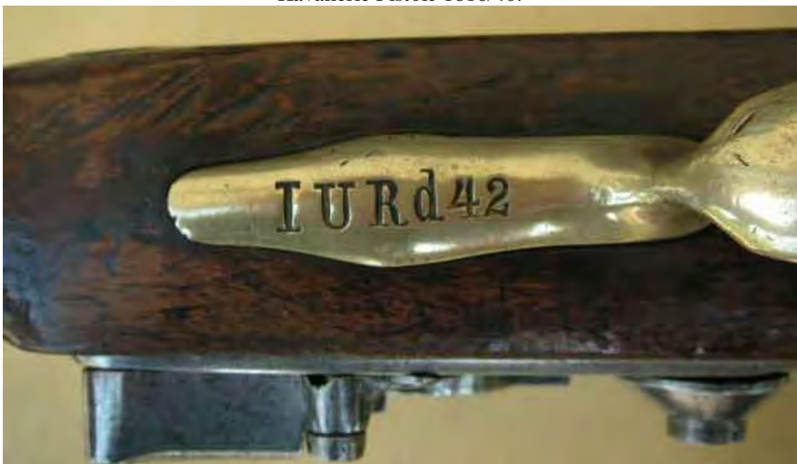
1. Ulanen-Regiment, 4. Eskadron, Waffe Nr. 42 (oben).