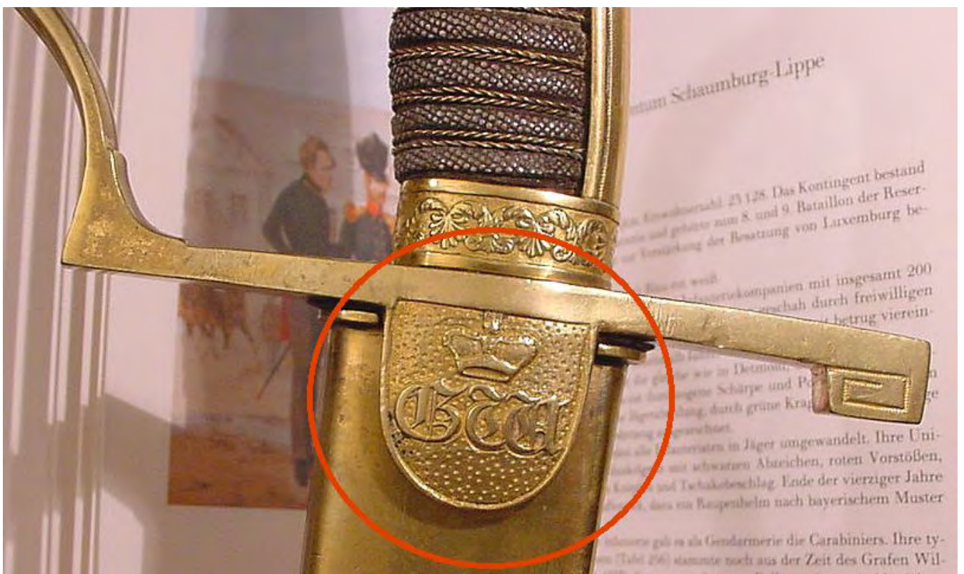
Bei Otto Flämig: Monogramme auf Münzen, Medaillen, Marken, Zeichen und Urkunden, Braunschweig 1988, finden sich 2 Monogramme GW unter Fürstenhut, die in ihrer optischen Darstellung zwar sowohl untereinander als auch gegenüber dem gesuchten Parierstangenmonogramm abweichen, aber möglicherweise trotzdem einen Hinweis auf die Herkunft des Säbels geben könnten, nämlich: Schaumburg-Lippe, Fürst Georg Wilhelm, Regierungszeit 1807 – 1860. Die Infanterie bestand im fraglichen Zeitpunkt aus einer Jäger-Abteilung von 200 Mann in 2 Compagnien und einer Reserve von 100 Mann, zusammen unter dem Kommando eines Stabsoffiziers. Je Compagnie ein Capitän, 1 Premier-Lieutenant und 1 Second-Lieutenant.