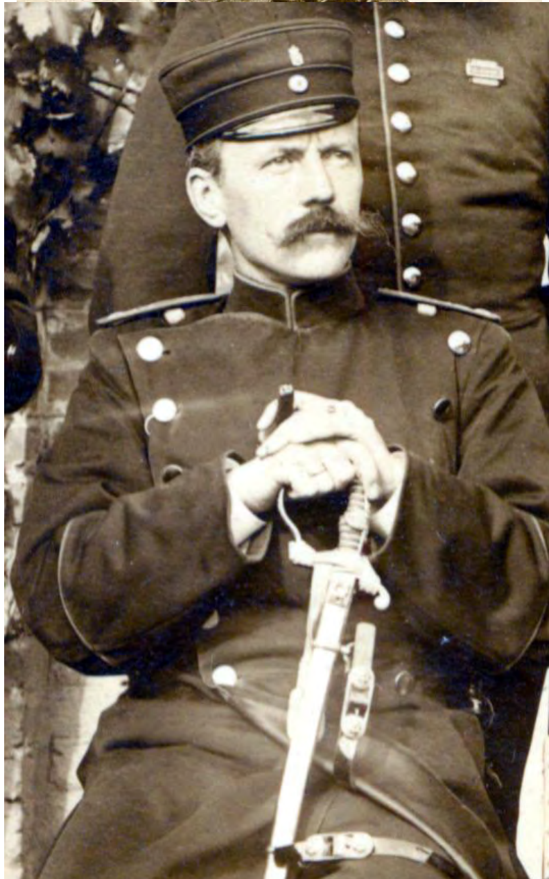
Obergrenzaufseher mit dem Säbel inmitten einer Gruppe von preussischen Grenzaufsehern. Als Bewaffnung teilweise das Grenzaufsehergewehr (G.A.G.) M/1879.